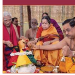
4. Religious Devotion, age 72 & onward Sannyasa Ashrama